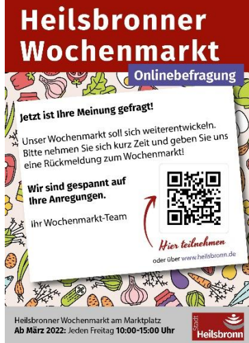
Abbildung 26: Flyer Befragung Wochenmarkt