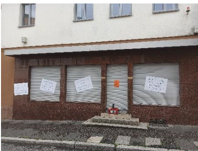
Abbildung 20: Kritik am Park(ing) Day