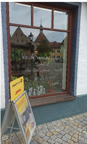
Abbildung 28: Zitataktion beim Blumenladen Zischler

Laut den Teilnehmenden soll die Zitataktion in den nächsten Jahren ebenfalls durchgeführt werden.