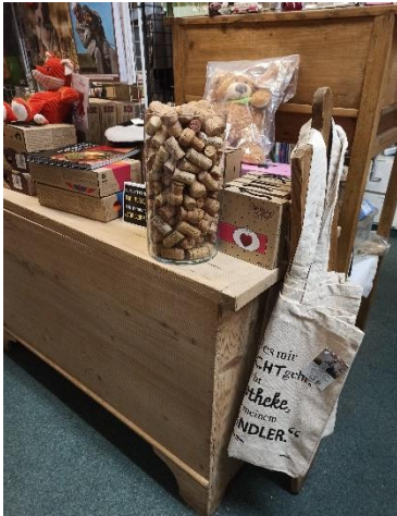
Abbildung 21: Schätze schätzen in der Buchhandlung am Turm