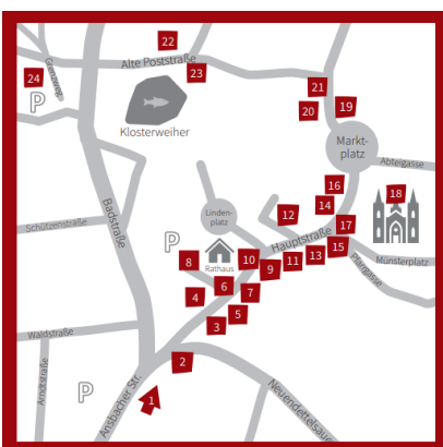
Abbildung 12: Übersichtskarte der Broschüre Stadträume

Es konnten 17 Gewerbetreibende und 7 Institutionen aus der Innenstadt als Teilnehmende gewonnen werden. Für die Fotos für die Broschüre wurden das Fotostudio Lichtblick aus Heilsbronn beauftragt. Der Druck wird über die Agentur für Medien, Druck und Organisation (AMDO) aus Heilsbronn abgewickelt.