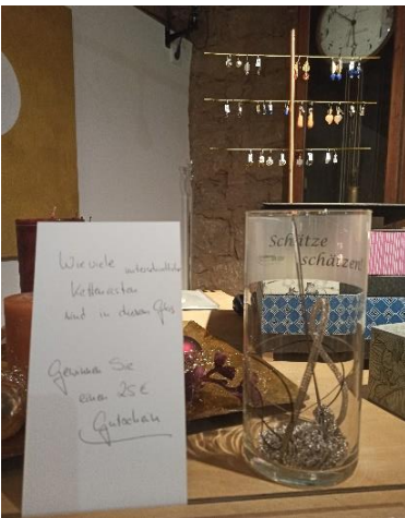
Abbildung 22: Schätze schätzen in der Goldschmiede Rammensee