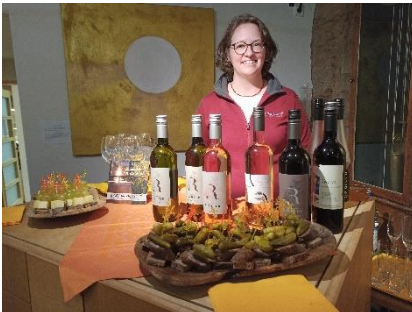
Abbildung 8: Weinverkostung in der Goldschmiede Rammensee bei Heilsbronn im Kerzenschein