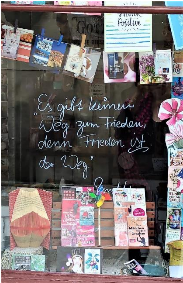
Abbildung 27: Zitataktion bei der Buchhandlung am Münster

Aus der Projektgruppe Gewerbe, Handel und Gastronomie kam die Idee eine Zitataktion zur Belebung der Innenstadt zu organisieren. In den Schaufenstern sollen jeweils zum Geschäft passende Zitate in schöner Schrift - Stichwort Handlettering – angebracht werden. Um die Aktion in der Öffentlichkeit bekannt zu machen und mehr Besuchende in die Innenstadt zu locken soll im Aktionszeitraum monatlich ein Gewinnspiel stattfinden. Die Besuchenden konnten Ihr Lieblingszitat wählen und einen HeilsbronnAKTIV Gutschein gewinnen, der wieder in den Heilsbronner Geschäften eingelöst werden kann. Das Citymanagement übernahm die Organisation des Gewinnspiels. Die Aktion wurde über den Projektfonds finanziert.