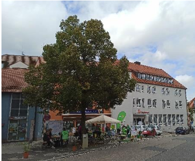
Abbildung 17: Gesamtansicht Park(ing) Day 2022