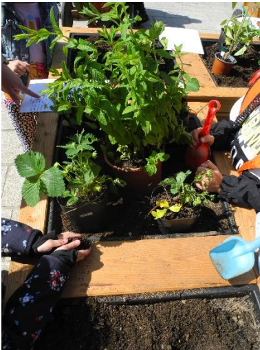
Abbildung 13: Pflanzaktion mit Kindergartenkindern

Gemeinsam mit der Projektgruppe Grün wurde zur Begrünung des Marktplatzes eine Pflanzaktion in Zusammenarbeit mit einem Kindergarten aus der Innenstadt geplant. Als Hochbeete sollen die bereits vorhandenen hölzernen Pflanzgefäße genutzt werden. Das Citymanagement kümmerte sich um die Organisation sowie um die Bekanntmachung der Aktion und unterstützt bei der Bepflanzung.