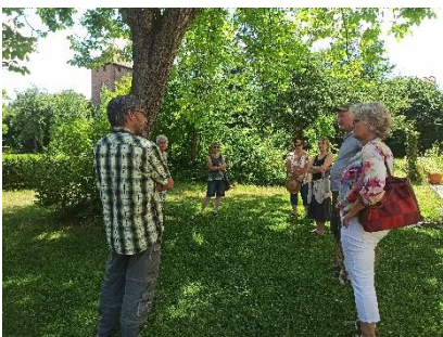
Abbildung 4: Stadtgärten zwischen den Toren; Vortrag im Pfarrgarten

Die Innenstadt von Heilsbronn ist „grüner“ als man denkt. Das meiste „Grün“ ist jedoch nicht im öffentlichen Raum zu finden, sondern verbirgt sich hinter den Häusern in privaten Gärten. Zusammen mit der Projektgruppe Grün will das Citymanagement mit der Aktion die grünen Oasen der Innenstadt einem größeren Publikum zugänglich machen. Es sollen einerseits Privatgärten für die Bevölkerung geöffnet werden und andererseits Vorträge zum Thema Klimawandel/-anpassung in städtischen/öffentlichen Bereichen referiert werden. Das Citymanagement übernahm die Organisation der Veranstaltung und die Werbung.