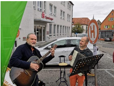
Abbildung 19: Musikalische Beglei- tung am Park(ing) Day