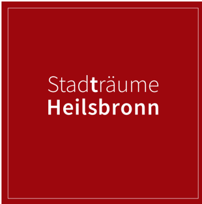
Abbildung 11: Titelbild der Broschüre Stadträume

Gemeinsam mit der Projektgruppe Gewerbe, Handel und Gastronomie entstand die Idee mittels eines hochwertigen Werbeflyers auf die Vielzahl unterschiedlicher Akteure der Heilsbronner Innenstadt hinzuweisen. Mit dem Zusammenspiel von Einzelhandel, Dienstleistung aber auch kulturellen Institutionen und Einrichtungen wie Museen, die Stadtbibliothek, Stadtführungen, dem Münster sowie Vereinen sollen die einzelnen Geschäfte und Einrichtungen beworben aber auch auf die Vielfalt und Qualität im gesamten Stadtraum der Innenstadt hingewiesen werden. Die Broschüre ist wie ein Rundgang aufgebaut, der vor dem Oberen Tor beginnend über die Hauptstraße und den Marktplatz zur Poststraße und dem Klosterweiher führt und am Grenzweg außerhalb der Innenstadt endet. Teilnehmen dürfen alle Gewerbetreibenden und Institutionen aus der Innenstadt, die der allgemeinen Öffentlichkeit zugänglich sind. Das Citymanagement übernimmt die Akquise und Koordination der Finanzierung über den Projektfonds, unterstützt bei Gestaltung und Layout sowie teilweise bei der Werbung.