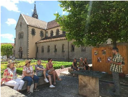
Abbildung 3: Stadtgärten zwischen den Toren; Vortrag am Münsterplatz

Die Innenstadt von Heilsbronn ist „grüner“ als man denkt. Das meiste „Grün“ ist jedoch nicht im öffentlichen Raum zu finden, sondern verbirgt sich hinter den Häusern in privaten Gärten. Zusammen mit der Projektgruppe Grün will das Citymanagement mit der Aktion die grünen Oasen der Innenstadt einem größeren Publikum zugänglich machen. Es sollen einerseits Privatgärten für die Bevölkerung geöffnet werden und andererseits Vorträge zum Thema Klimawandel/-anpassung in städtischen/öffentlichen Bereichen referiert werden. Das Citymanagement übernahm die Organisation der Veranstaltung und die Werbung.