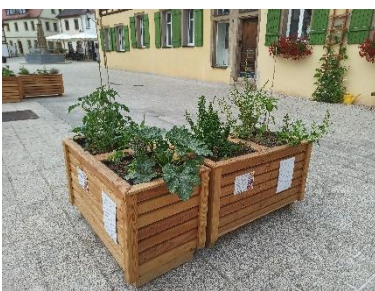
Abbildung 14: Hochbeet am Marktplatz

Mit dem Kindergarten „Spatzennest“ konnte ein innenstädtischer Kindergarten als Kooperationspartner gefunden werden. Eine gemeinsame Einführung in das Thema Gemüsepflanzen mit den Kindergartenkindern konnte aufgrund geltender Coronamaßnahmen nicht durchgeführt werden und wurde deshalb vom Personal des Kindergartens übernommen. Die Gemüsepflanzen wurden von Elke vom Brocke von der Goldschmiede Rammensee gespendet, die auch bei der Pflanzaktion mit anpackte. Die Pflanzgefäße wurden von Mitarbeitenden des Bauhofs aufgestellt und vorab bereits mit Blumenerde befüllt.