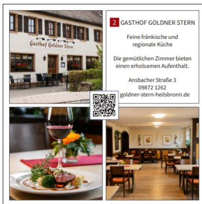
Abbildung 10: Teilnehmerauftritt "Goldner Stern" in der Broschüre Stadträume

Gemeinsam mit der Projektgruppe Gewerbe, Handel und Gastronomie entstand die Idee mittels eines hochwertigen Werbeflyers auf die Vielzahl unterschiedlicher Akteure der Heilsbronner Innenstadt hinzuweisen. Mit dem Zusammenspiel von Einzelhandel, Dienstleistung aber auch kulturellen Institutionen und Einrichtungen wie Museen, die Stadtbibliothek, Stadtführungen, dem Münster sowie Vereinen sollen die einzelnen Geschäfte und Einrichtungen beworben aber auch auf die Vielfalt und Qualität im gesamten Stadtraum der Innenstadt hingewiesen werden. Die Broschüre ist wie ein Rundgang aufgebaut, der vor dem Oberen Tor beginnend über die Hauptstraße und den Marktplatz zur Poststraße und dem Klosterweiher führt und am Grenzweg außerhalb der Innenstadt endet. Teilnehmen dürfen alle Gewerbetreibenden und Institutionen aus der Innenstadt, die der allgemeinen Öffentlichkeit zugänglich sind. Das Citymanagement übernimmt die Akquise und Koordination der Finanzierung über den Projektfonds, unterstützt bei Gestaltung und Layout sowie teilweise bei der Werbung.