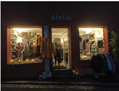
Abbildung 6: Atelier bei Heilsbronn im Kerzenschein