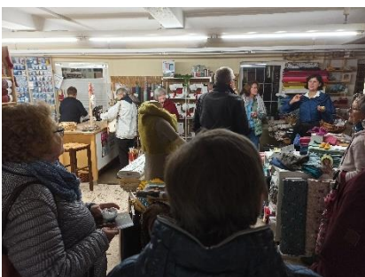
Abbildung 9: Stadtführung bei Heilsbronn im Kerzenschein

Als Alternative für die Veranstaltung „Feuer und Flamme“, die zuerst aufgrund der Baumaßnahmen in der Innenstadt und darauffolgend wegen der Corona-Pandemie nicht wie gewohnt stattfinden konnte, wird seit 2020 die Veranstaltung „Heilsbronn im Kerzenschein“ von der Projektgruppe Gewerbe, Handel und Gastronomie durchgeführt. Die an der Aktion teilnehmenden Geschäfte verlängern an diesem Freitag ihre Öffnungszeiten bis 20:00 Uhr und beleuchteten ihre Geschäfte bei Eintritt der Dämmerung von außen und/oder innen mit Kerzen oder Laternen. Weitere Institutionen wie Museen, Stadtführer:innen und Pfarrgemeinde sind ebenso in die Aktion eingebunden. Das Citymanagement unterstützt bei der Organisation der Veranstaltung sowie der Werbung. Die Finanzierung erfolgt über den Projektfonds.