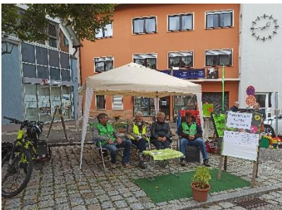
Abbildung 18: Teilnehmer Park(ing) Day