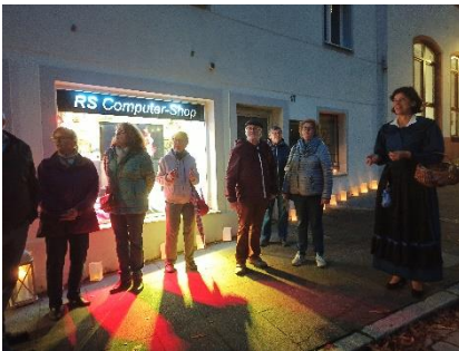
Abbildung 7: Stadtführung bei Heilsbronn im Kerzenschein