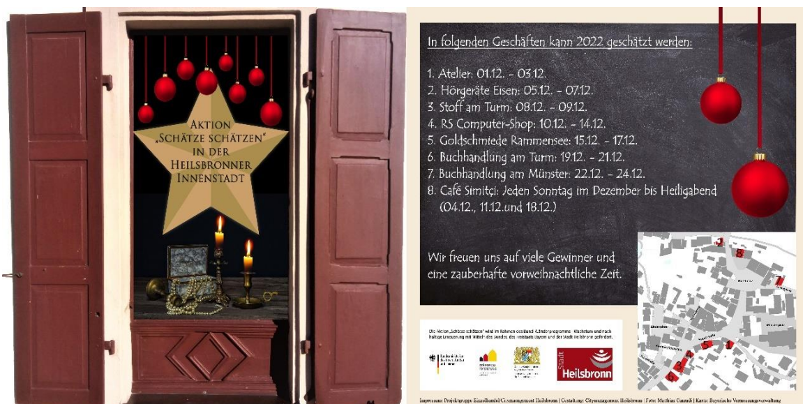
Abbildung 23: Flyer Schätze schätzen 2022

Dieses Jahr konnten zwei neue Läden gewonnen werden, die an der Aktion teilnahmen. Besonders erfreut waren die anderen Teilnehmer, dass mit dem Café Semitçi ein erst in diesem Jahr eröffnetes Geschäft mitwirkte. Ein großer Vorteil der Teilnahme des türkisch-deutschen Cafés waren die Sonntagsöffnungszeiten. So konnten die Schätzzeiten diese Mal auch auf die kompletten Wochenenden ausgedehnt werden.