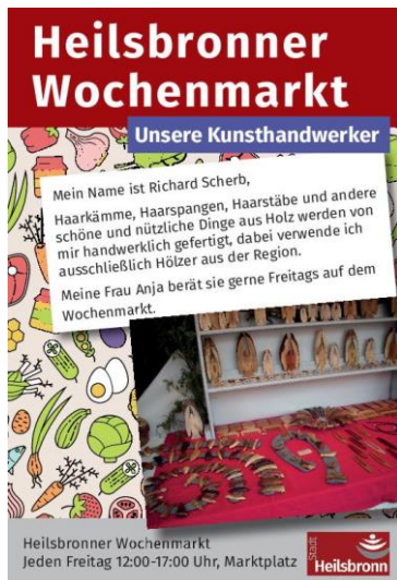
Abbildung 24: Vorstellung