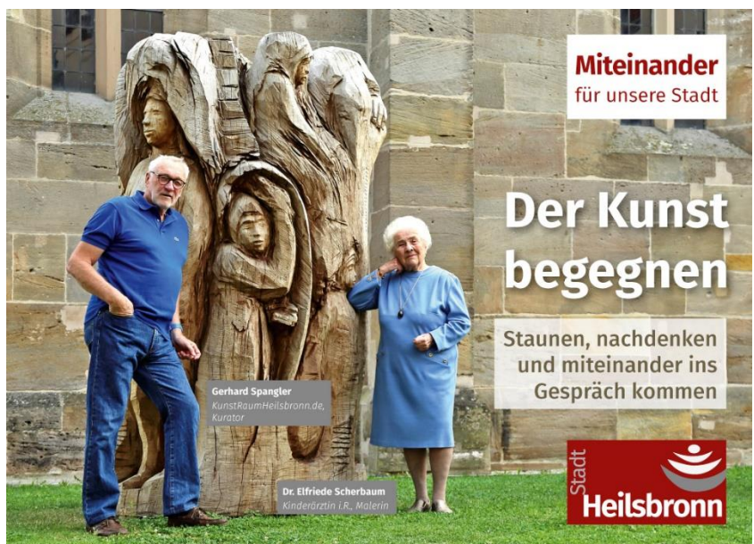
Abbildung 5: Testimonialkampagne / Thema 7 "Kunst" (Juni 2019)