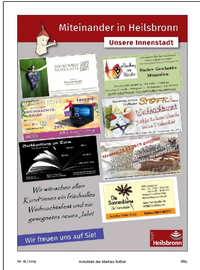
Abbildung 10: Anzeige der Geschäfte aus der Innenstadt

Die Aktion „Buchstabenrätsel“ wurde 2019 wieder durchgeführt. Es nahmen über 100 Kinder an der Verlosung teil. Im nächsten Jahr ist eine Wiederholung der Aktion geplant.