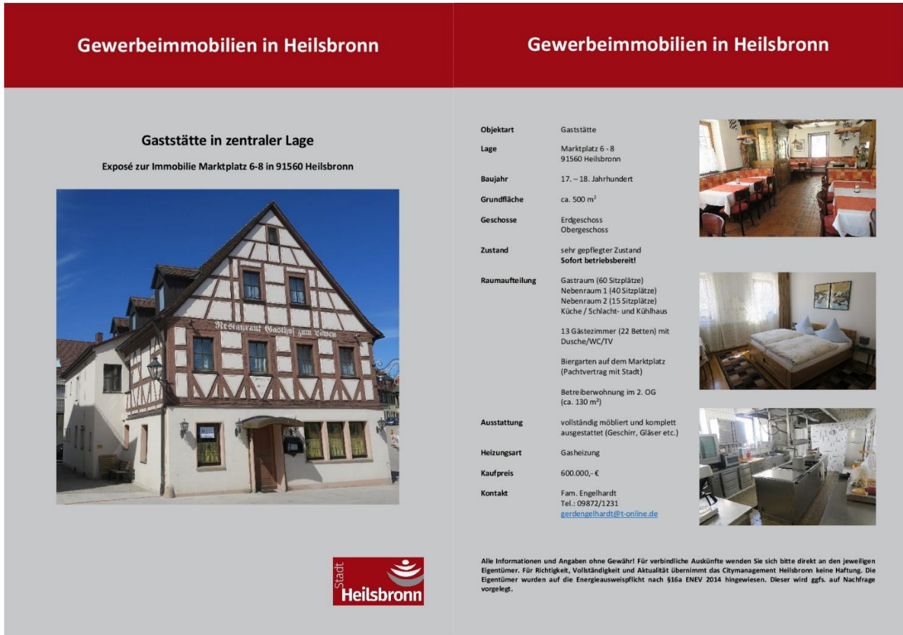
Abbildung 8: Exposé Immobilie am Marktplatz 6-8

Gemeinsam mit dem Sanierungsberater, der Stadtverwaltung von Heilsbronn und dem Citymanagement wurde das weitere Vorgehen hinsichtlich der Innenstadtentwicklung besprochen. Dabei wurde die Überarbeitung des kommunalen Förderprogramms und die anschließende Erstellung eines städtebaulichen Rahmenplans beschlossen.