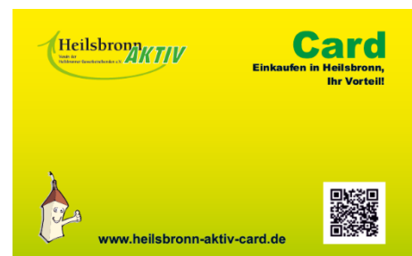
Abbildung 11: HeilsbronnAKTIV Card

Die „HeilsbronnAKTIV Card“ wurde im Sommer 2019 eingeführt. Bei 28 Betrieben aus Heilsbronn können die Kunden mit der Kundenkarte Rabatte und Vorteilsangebote bekommen. Aktuelle Informationen und eine Liste der Teilnehmer und deren Rabatte und Vorteilsangebote lässt sich auf der Seite des Vereins der Heilsbronner Gewerbetreibende einsehen ( www.heilsbronn-aktiv.card ).