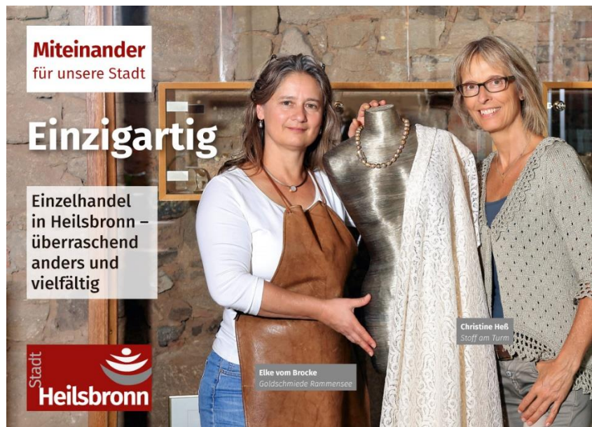
Abbildung 4: Testimonialkampagne / Thema 5 "Einzelhandel" (April 2019)

dass die Imagekampagne generell ansprechend gestaltet war und die ausgewählten Heilsbronner Persönlichkeiten die Stärken und Besonderheiten der Stadt gut repräsentierten. Heilsbronn wird vor allem mit dem Münster/Kloster in Verbindung gebracht. Als positiv wurden das kulturelle Angebot, das Zusammenleben sowie eine gute Infrastruktur und Verkehrsanbindung bemerkt. Die Innenstadt wird als leer und trist wahrgenommen. Dies zeigten schon die Ergebnisse der Befragung im Zuge des EEK 2018. An dieser Stelle ergibt sich weiterhin großer Handlungsbedarf. Grundsätzlich kann man sagen, dass das Projekt Wirkung gezeigt hat, da 11% der Befragten die Stärken und Besonderheiten von Heilsbronn durch die Testimonialkampagne bewusster geworden sind.