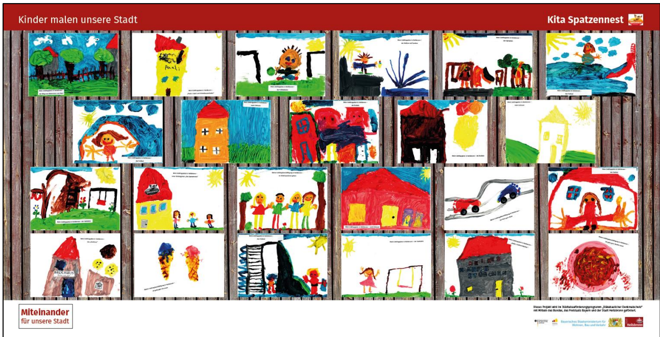
Abbildung 6: Bauzaunbanner der "Gestaltungsaktion Bauzaun"