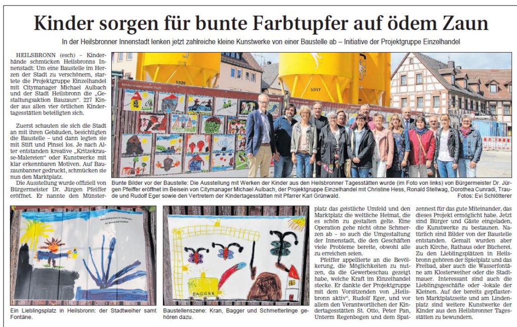
Abbildung 2: Artikel über die Gestaltungsaktion Bauzaun (FLZ 12.06.2019)

Die Homepage der Stadt Heilsbronn und das Heilsbronner Monatsblatt sowie eine kontinuierliche Pressearbeit sind elementare Bestandteile in der Kommunikation des Citymanagements.