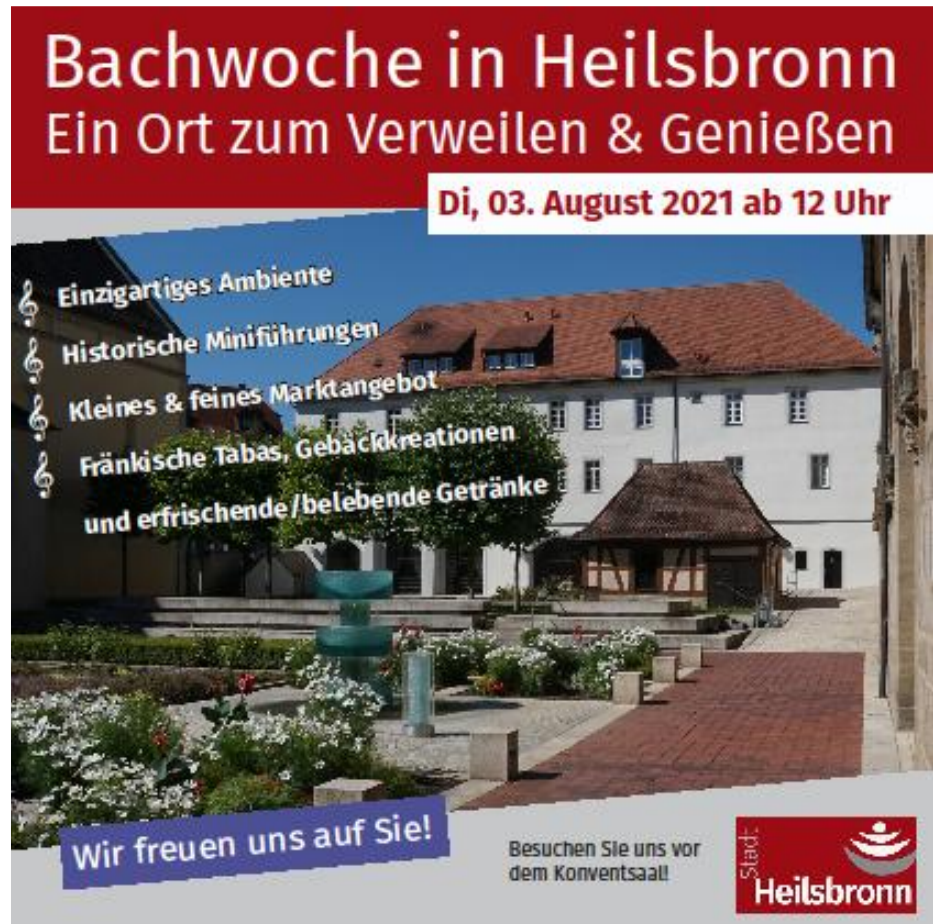
Abbildung 9: Entwurf Flyer/Anzeige „Bachwoche in Heilsbronn“

Geplant sind neben der kulinarischen Verköstigung und den Präsentationen der Gewerbetreibenden auch historische Miniführungen im Münster und im Klosterumfeld.