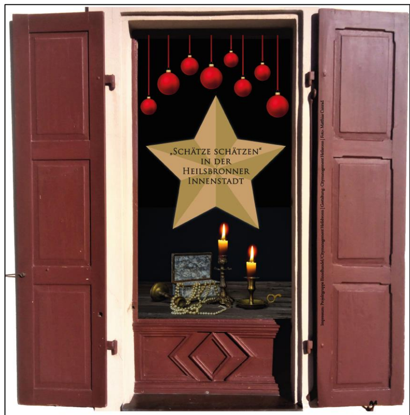
Abbildung 7: Vorderseite des Flyers der Aktion "Schätze schätzen"