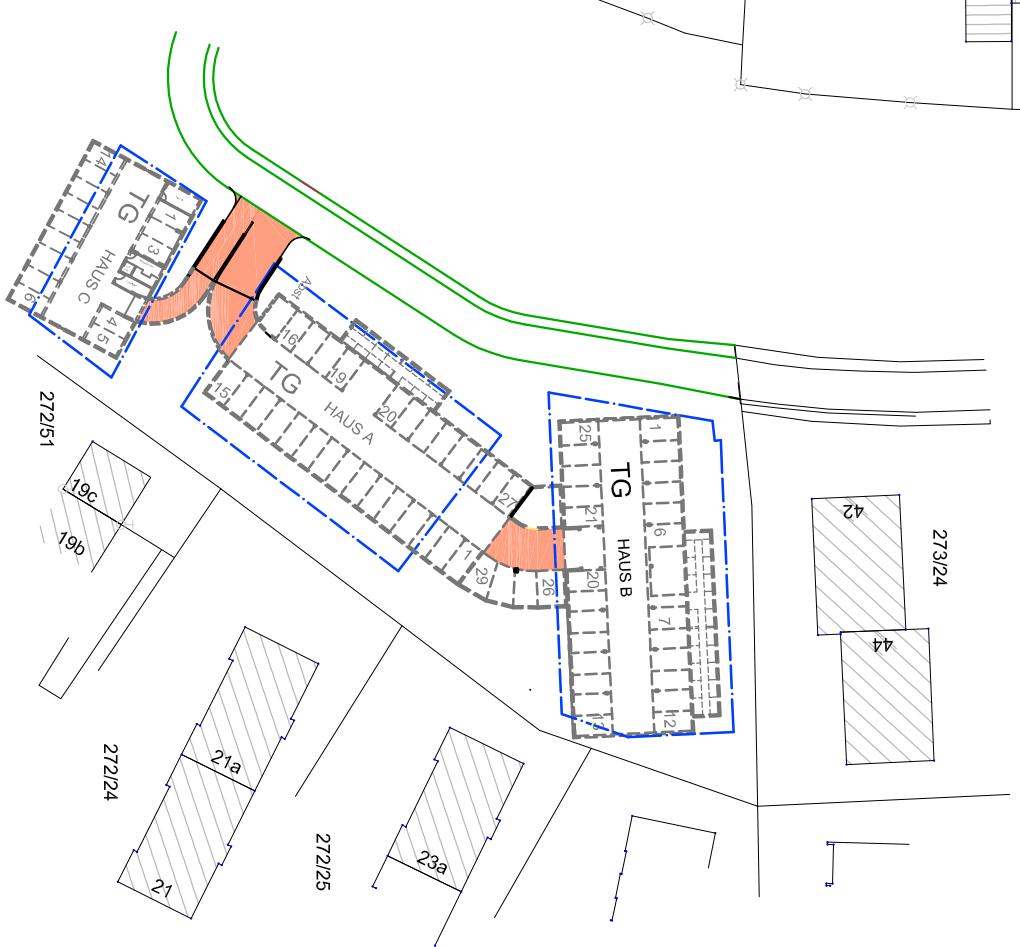
Darstellung der Tiefgaragen unter den Mehrfamilienhäusern mit Zufahrt