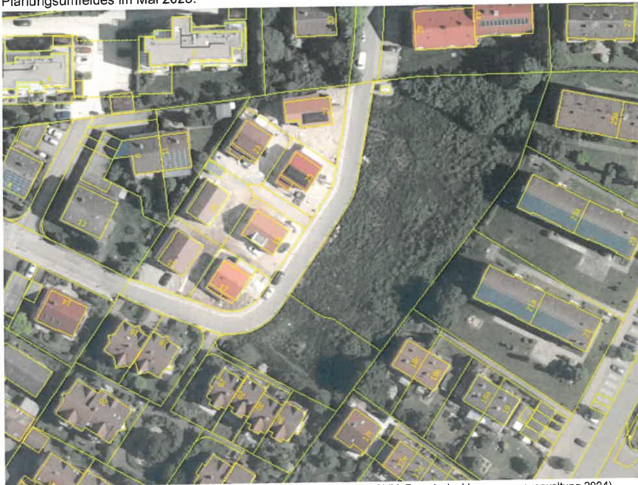
Luftbild o. M. mit Darstellung des Planungsumfeldes im Mai 2023

Nachstehendes Luftbild der Bayerischen Vermessungsverwaltung zeigt den Entwicklungszustand der des Planungsumfeldes im Mai 2023: