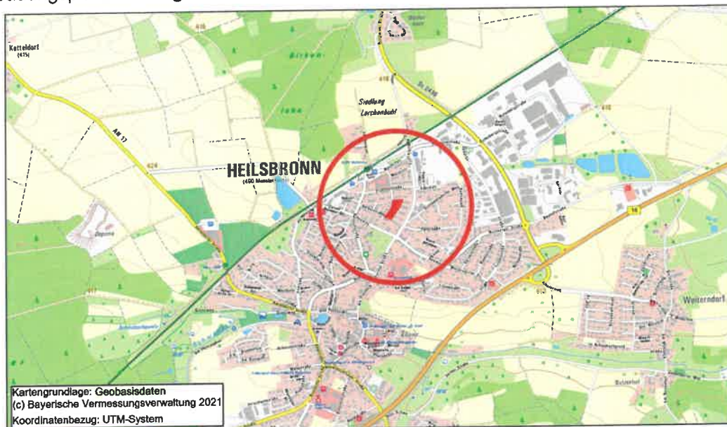
Übersichtslageplan zur Lage des Geltungsbereichs der Teilaufhebung der vorhabenbezogenen 1. Bebauungsplanänderung „Östlich der Herbststraße/Nördlich des Heuwegs“ ohne Maßstab

Der genaue Umgriff zur Aufhebung ist aus dem Planblatt zur Teilaufhebung des vorhabenbezogenen 1. Bebauungsplanänderung zu entnehmen. Das betreffende Gebiet ist wie folgt im Stadtgebiet verortet.