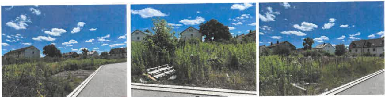
Ortsbilder des Grundstückszustand im Juli 2024

Die zur Aufhebung vorgesehenen Flächen sind im Eigentum des Vorhabenträgers. Eine Bebauung ist dort bisher nicht erfolgt. Die Flächen liegen brach und sind durch mangelnde Pflege zwischenzeitlich wild bewachsen. Es entwickelt sich bereits eine Ruderalflora. Die örtliche Situation stellt sich im Juli 2024 wie folgt dar: