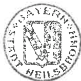
Träger 1. Bürgermeister