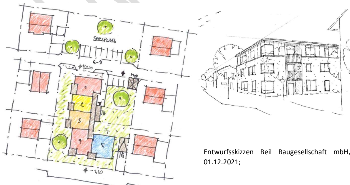
Entwurfsskizzen Beil Baugesellschaft mbH, 01.12.2021;

In der Ausschreibung war zur Angebotsabgabe ein Bebauungsvorschlag mit Baukörper und Tiefgarage gefordert.