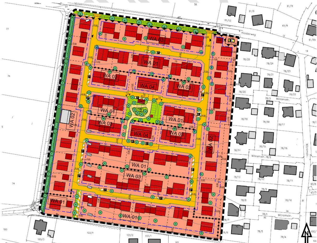
Ausschnitt Bebauungsplan Nr. B4 – An den Schwabachauen, 2015; ohne Maßstab

Der rechtskräftige Bebauungsplan Nr. B4 vom 17. September 2015 sieht im Zentrum des Plangebietes auf zwei Parzellen (WA 04) eine leicht verdichtete Bebauung für Mehrfamilienwohnhäuser mit einem dazwischenliegenden Bereich für einen Generationenspielplatz vor. Hier soll die Möglichkeit bestehen, „geeigneten Wohnraum für Senioren im dörflichen Umfeld“ (siehe Begründung zum B-Plan Nr. B4, Punkt 6.1) und eine Grünfläche mit Spielgeräten als Quartiersplatz zu schaffen.