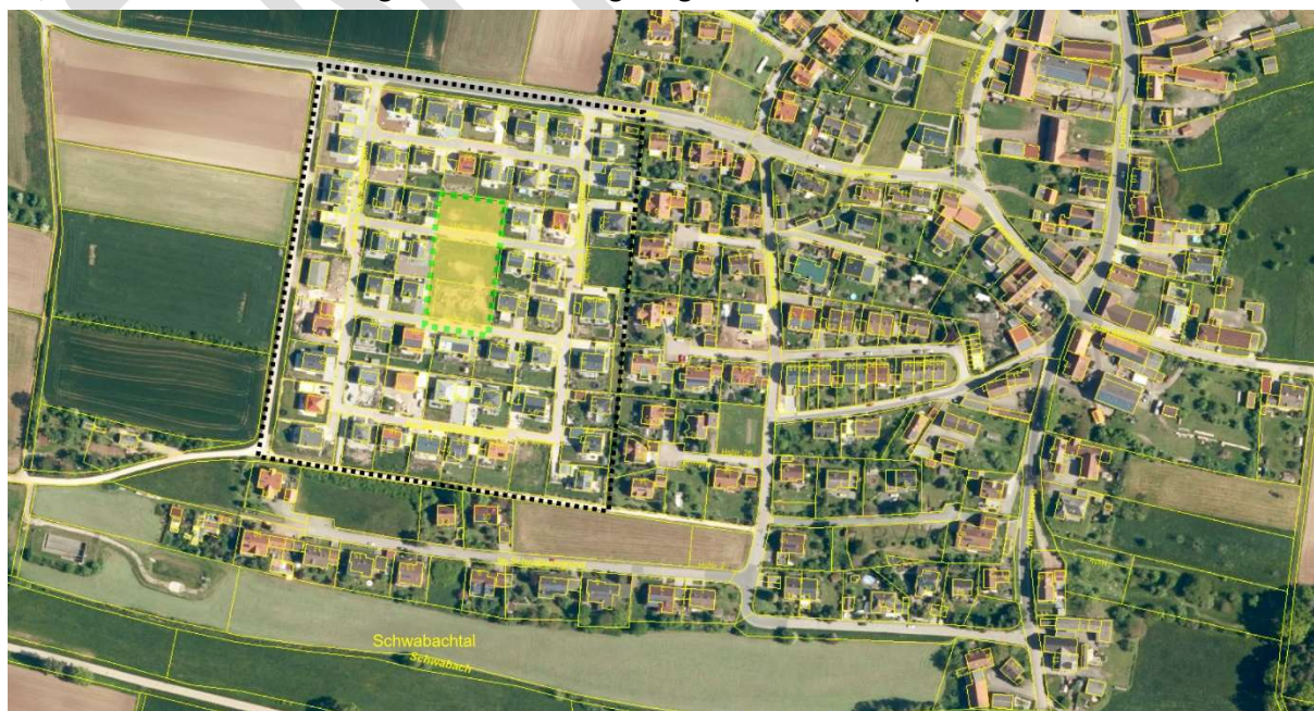
ohne Maßstab

Der räumliche Geltungsbereich liegt im Zentrum des rechtskräftigen Bebauungsplanes Nr. B4 und umfasst die Flurstücke Nrn. 78/50, 78/45, 79/23 und Teilflächen der Straßenflächen Fl. Nr. 78/59 und 79/26. Die Größe des Geltungsbereiches beträgt insgesamt ca. 3.138 qm.